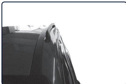
Podélný střešní nosič se instaluje na vnější stranu od podélné střešní lišty vozu.

Určete přední a zadní patku nosiče (uvnitř patky písmeno „P“ označuje přední patku). Pokud je vůz vybaven střešním oknem dbejte na to, aby jste střešním podélným nosičem neomezili funkci střešního okna.