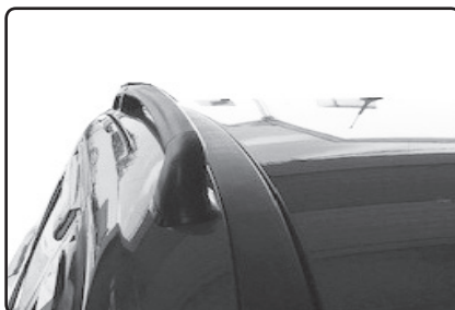
Zadní patku umístěte 8 mm od vnější hrany střešní lišty vozu.