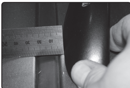
Zadní patku umístěte 5 mm od hrany podélné střešní lišty vozu.