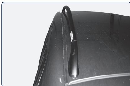
Podélný střešní nosič se instaluje na vnitřní stranu od podélné střešní lišty vozu.

Určete přední a zadní patku nosiče (uvnitř patky písmeno „P“ označuje přední patku). Pokud je vůz vybaven střešním oknem dbejte na to, aby jste střešním podélným nosičem neomezili funkci střešního okna.