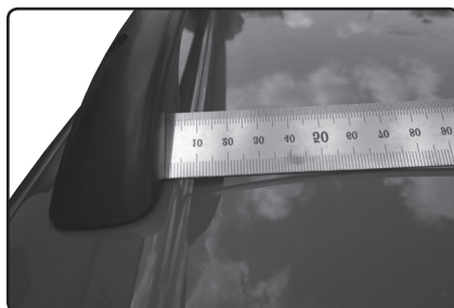
Přední patku umístěte 5 mm od hrany prolisu střechy vozu.