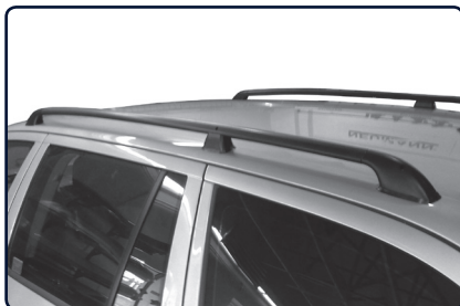
Podélný střešní nosič se instaluje na vnější stranu od prolisu střechy vozu.

Určete přední a zadní patku nosiče (uvnitř patky písmeno „P“ označuje přední patku). Pokud je vůz vybaven střešním oknem dbejte na to, aby jste střešním podélným nosičem neomezili funkci střešního okna.