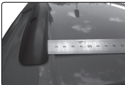
Zadní patku umístěte 5 mm od hrany prolisu střechy vozu.