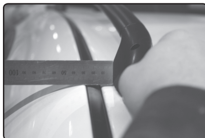
Přední patku umístěte 10 mm od vnitřní hrany podélné střešní lišty vozu.