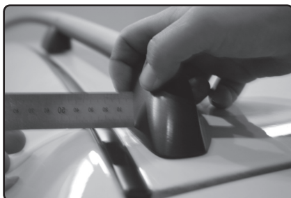
Zadní patku umístěte 10 mm od vnitřní hrany podélné střešní lišty vozu.