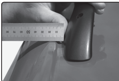
Zadní patku umístěte 10 mm od hrany prolisu střechy vozu.