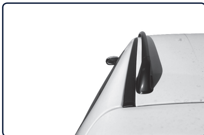
Podélný střešní nosič se instaluje na vnitřní stranu od prolisu střechy vozu.

Určete přední a zadní patku nosiče (uvnitř patky písmeno „P“ označuje přední patku). Pokud je vůz vybaven střešním oknem dbejte na to, aby jste střešním podélným nosičem neomezili funkci střešního okna.