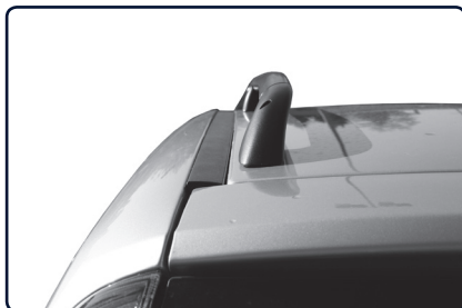
Podélný střešní nosič se instaluje na vnitřní stranu od podélné střešní lišty vozu.

Určete přední a zadní patku nosiče (uvnitř patky písmeno „P“ označuje přední patku). Pokud je vůz vybaven střešním oknem dbejte na to, aby jste střešním podélným nosičem neomezili funkci střešního okna.