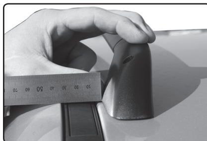
Přední patku umístěte 8 mm od vnější hrany kovové střechy vozu.