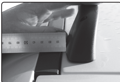
Zadní patku umístěte 8 mm od vnější hrany kovové střechy vozu.